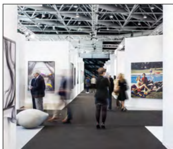
ИСКУССТВО В МОНАКО Art in Monaco