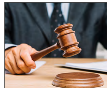
АРТ-РЫНОК The Art Market